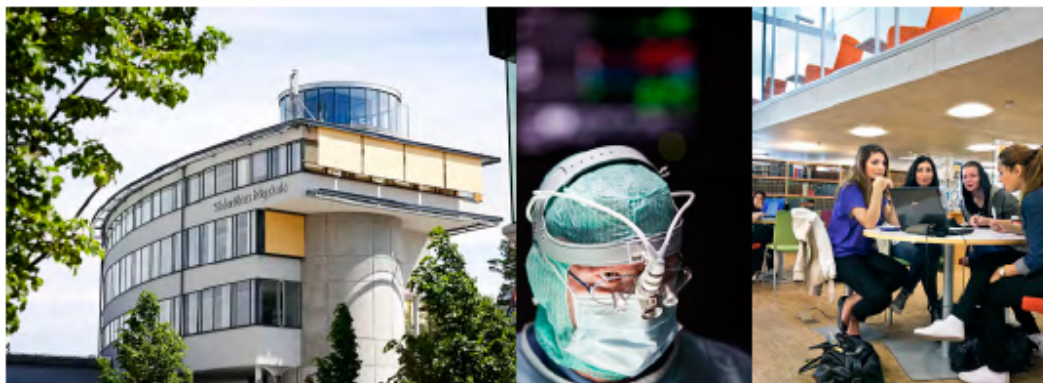
Figur 22: Innovativa miljöer